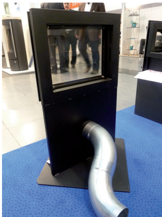
Mit externem Verbrennungsluftanschluß